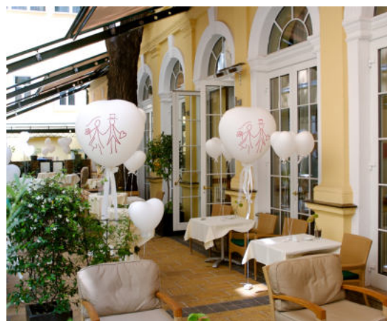
Hofgarten für den Aperitif