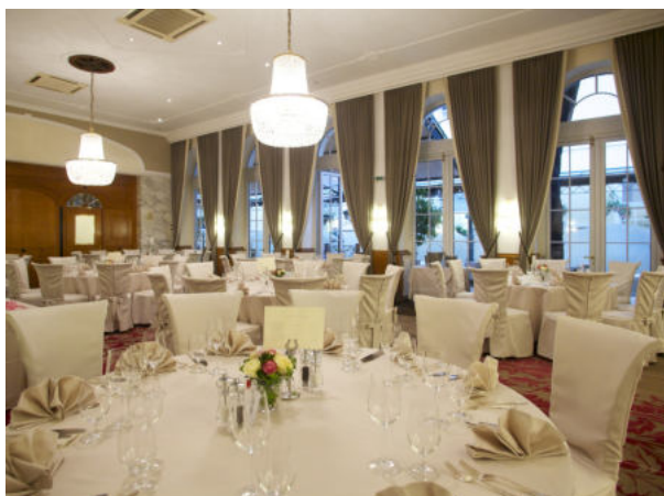
Festsaal 235 m 2 - in 3 Teile unterteilbar